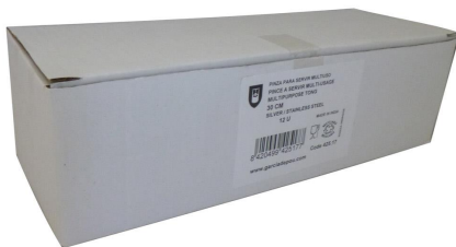
Image du paquet

Règlement (CE) n° 2023/2006 de la Commission du 22 décembre 2006 relatif aux bonnes pratiques de fabrication des matériaux et objets destinés à entrer en contact avec des denrées alimentaires.